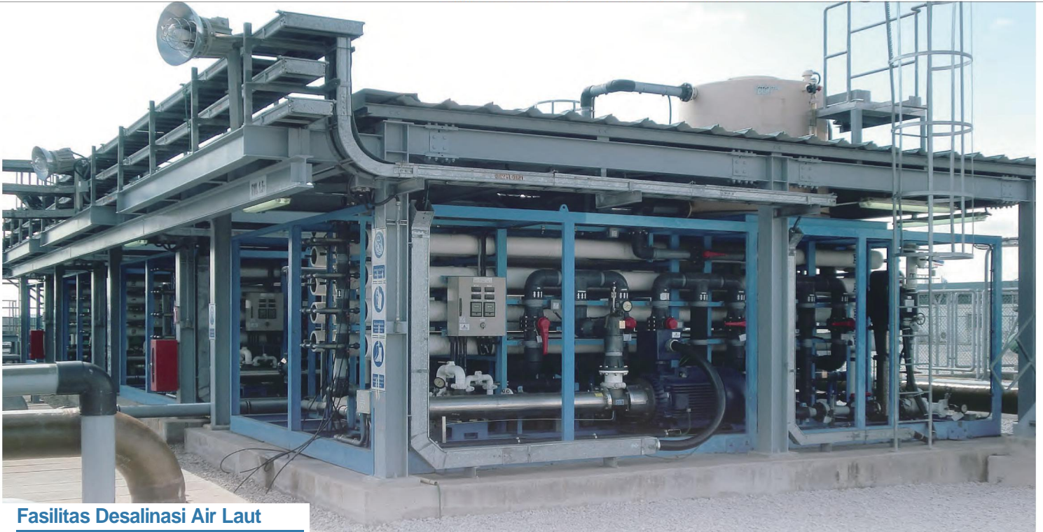
Fasilitas Desalinasi Air Laut

Ukuran, Bentuk dan Operabilitas Dapat Disesuaikan Dengan Kebutuhan Pelanggan. Semua Produk Kami Dibuat Untuk Kemudahan Pengoperasian.