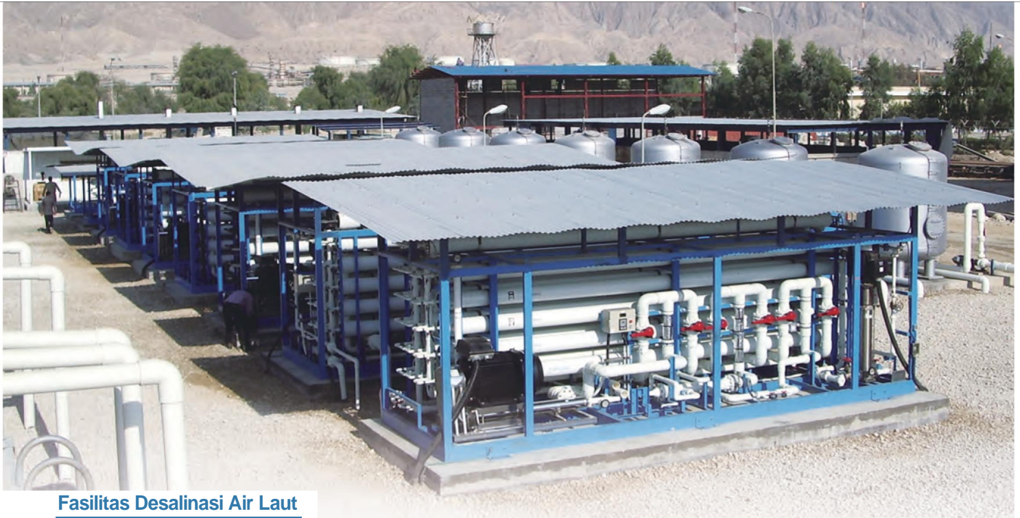
Fasilitas Desalinasi Air Laut

Ukuran, Bentuk dan Operabilitas Dapat Disesuaikan Dengan Kebutuhan Pelanggan. Semua Produk Kami Dibuat Untuk Kemudahan Pengoperasian.